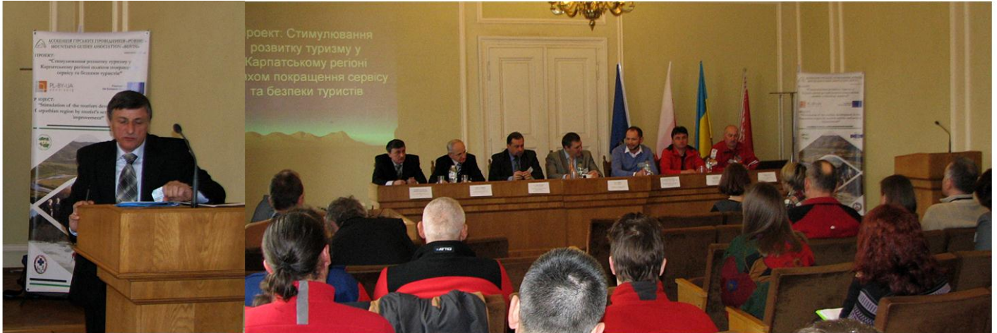
Фото-звіт Міжнародної конференції «Стимулювання розвитку туризму у Карпатському регіоні шляхом покращення сервісу та безпеки туристів».

79008, Україна, м. Львів, вул. Кривоноса 10/2 www.rovin.com.ua тел.: +38 067 737 61 63, тел./факс.: +380 32 275 22 79 е-пошта: rovin@i.ua